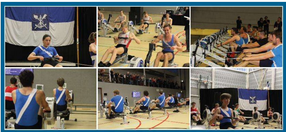
Amsterdam World Ergohead

De Amsterdam World Ergohead is samen met andere wedstrijden, zoals het NK Indoor Roeien, een meetmoment in de winter. 2014 is een bijzonder jaar want dit jaar wordt de Ergohead tweemaal gehouden, 7 december 2014 is het alweer zover. Een ruil met de NKIR zou de lange baanroeiers beter uitkomen in de winter, een 2K past meer bij de opening van het seizoen. We zullen zien. In ieder geval kan elke kan hier roeier zien op welk niveau hij of zij staat.