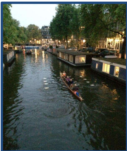
Nationale Avondtocht