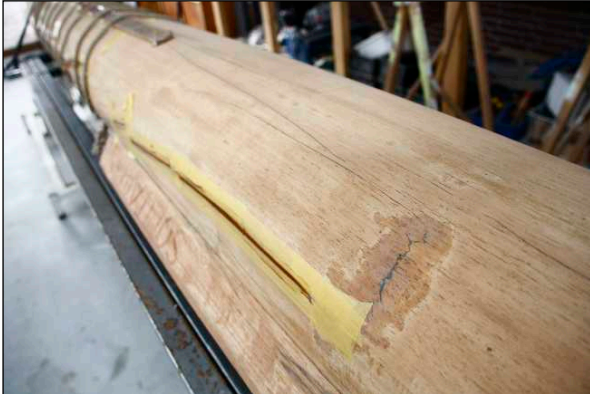
De Solitair II is nu helemaal kaal. Daardoor nu ook goed te zien reparaties uit het verleden.