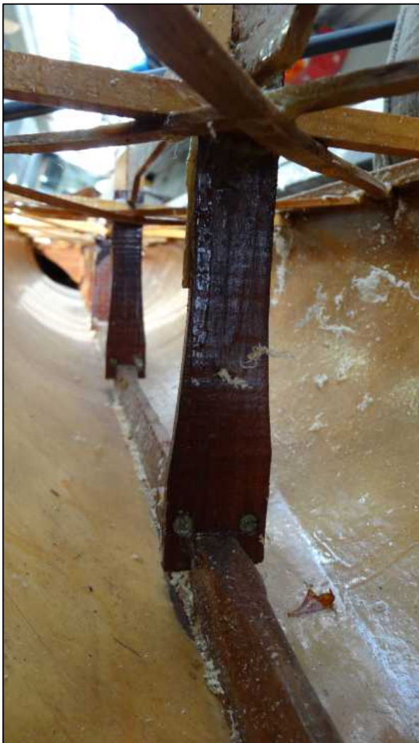
Binnenwerk van de Solitair II.