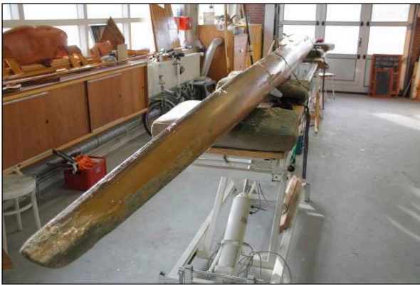
Solitair II in de werkplaats op de fysiobank voor restauratie.